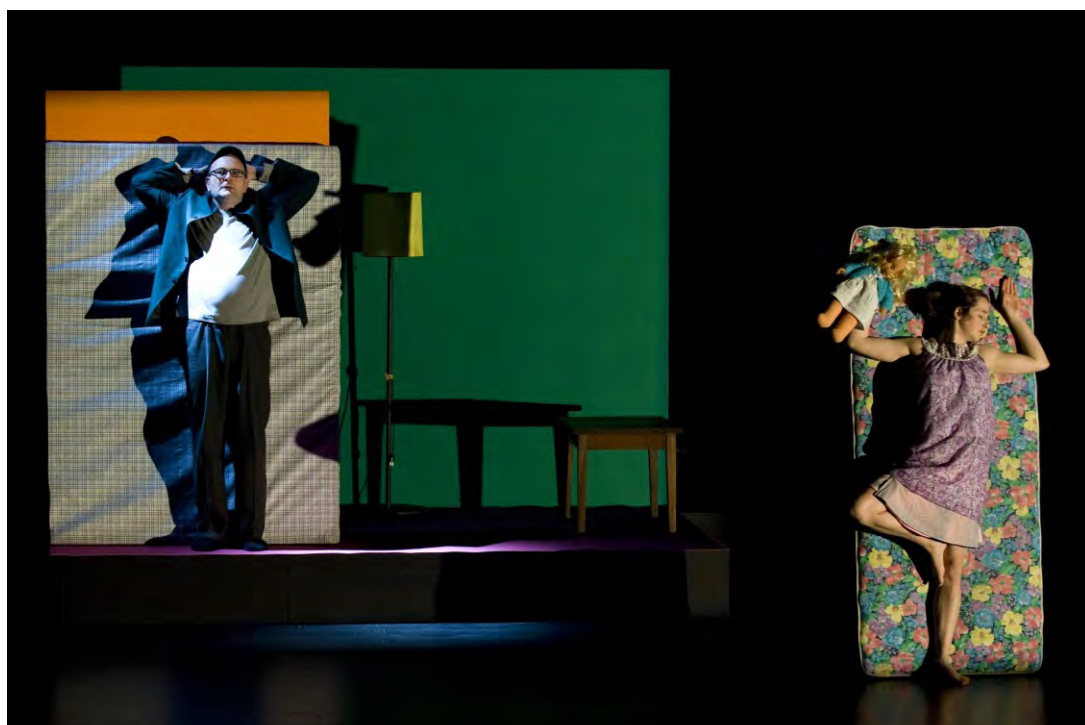
Théâtre de la Comédie, QUARTIER LOINTAIN , librement adapté de Jirô Taniguchi. Mise en scène Dorian Rossel. Du 20 février au 8 mars 2009.